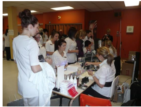
Une démonstration en cours lors de la Journée Coup d'œil, le 7 novembre dernier.