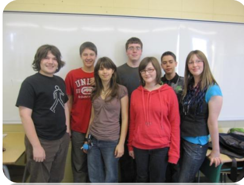
Les membres organisateurs de la Jeune COOP Club Otaku.

La Jeune COOP Club Otaku est donc un projet d'éducation à la coopération visant à répondre à un besoin collectif. Elle est accréditée par le Conseil québécois de la coopération et de la mutualité et sera administrée selon les règles de fonctionnement des