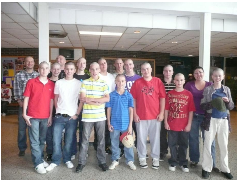
Une bonne partie des participants au défi « Têtes à prix ».

Le 23 octobre, des représentants de l'école du Mistral se sont rendus aux Galeries de Mont-Joli pour témoigner de leur expérience, dans le cadre d'un défi « Têtes à prix » qui s'y est également déroulé. Cette importante participation de l'école du Mistral au Défi « Têtes à prix » témoigne une fois de plus de l'implication de cette école dans des causes humanitaires.