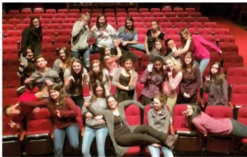
Les élèves de français-théâtre de l'école du Mistral

Mont-Joli, le 18 mars 2014 – L'Harmonie du Mistral et la troupe La savane royale du cours de français-théâtre de l'école du Mistral présenteront la comédie musicale Le Roi lion au grand public les 8 et 9 avril à 19 heures et le 12 avril à 14 heures. Les billets seront en vente dès le lundi 23 mars à l'accueil de l'école du Mistral et auprès des élèves participants au coût de 15 $ pour les adultes et de 8 $ pour les enfants. Des représentations scolaires auront également lieu.