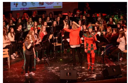
Les élèves de l'Harmonie de l'école du Mistral