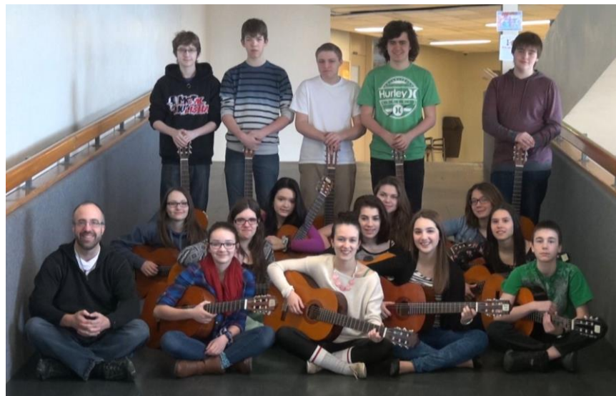
Les ensembles de guitares de l'école du Mistral remportent l'or et l'argent au dernier Musicfest de Montréal

Mont-Joli, le 8 avril 2015 – L'école du Mistral est très fière de faire savoir que les membres des ensembles de guitares Relève, Espoir et Senior, respectivement de première, troisième, puis quatrième et cinquième secondaire ont tous mérité une note d'or lors du dernier Musicfest de Montréal. Les élèves membres de l'ensemble Impact, de deuxième secondaire, ont pour leur part décroché une belle note d'argent.