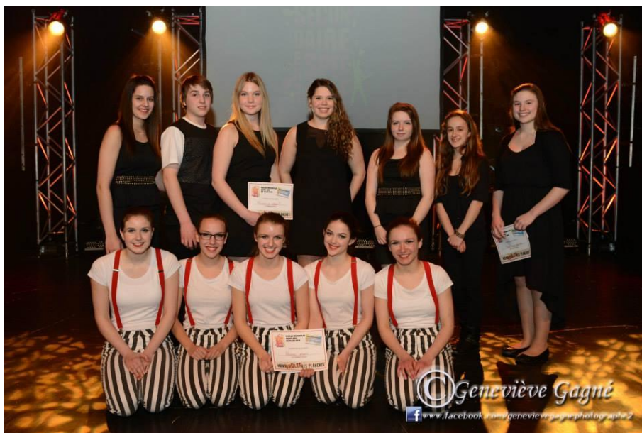
Les gagnants de la finale régionale de Secondaire en spectacle à l'école du Mistral

Secondaire en spectacle est un concours en arts de la scène présent partout au Québec qui permet aux jeunes de niveau secondaire de développer leurs talents dans les différentes disciplines des arts de la scène. Secondaire en spectacle est chapeauté par l'Unité régionale de loisir et de sport du Bas-Saint-Laurent.